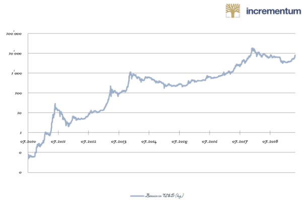
Abbildung 1: Logarithmische Darstellung der Preisentwicklung von Bitcoin

Bitcoin war die erste und ist nach wie vor die populärste Kryptowährung. Darüber hinaus ist sie die wichtigste auf Blockchain Technologie basierende Anwendung.